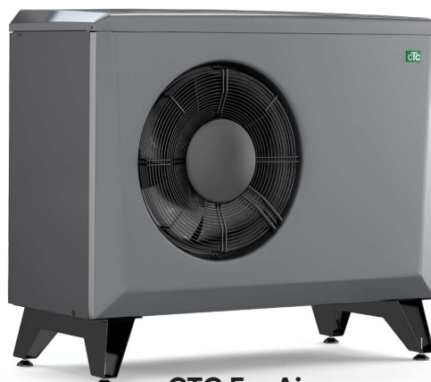
CTC EcoAir 406-408/600M