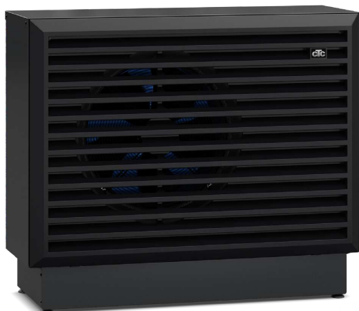
CTC EcoAir 700M

– för mer utförlig information se respektive produktblad.