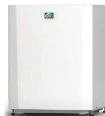
CTC EcoPart 406-412/600M